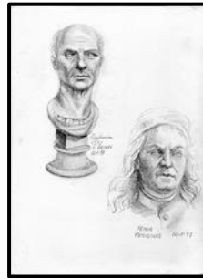
Drawings at the Pietro Vannuci Academy (24 x 33)