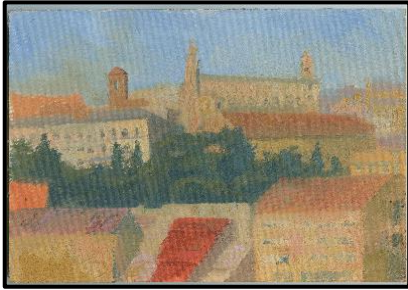
Views of Perugia (27 x 19) Oil painting on canvas. 1997