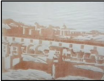
Ponte Vecchio (42 x 35) Linocut. 1/10. 2009